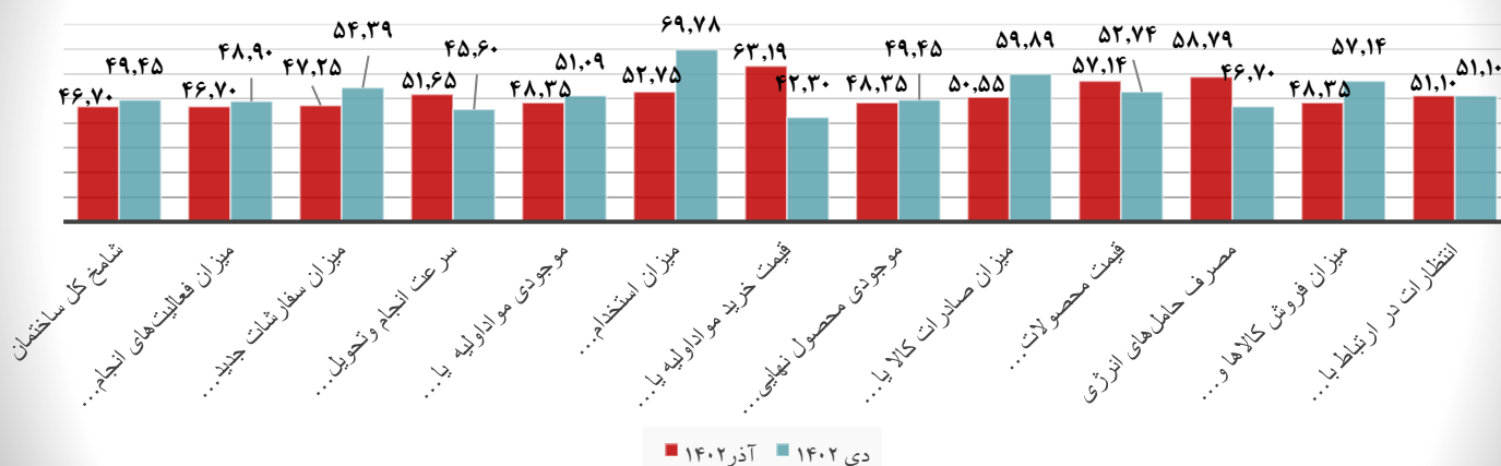
جدول ۳: عدد شامخ ترکیبی (تولید، خدمات و ساختمان) کشورهای منتخب در دو ماه اخیر